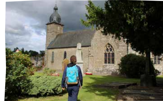
Le temple d'Athis, inauguré le 3 avril 1866 - pupitre 4