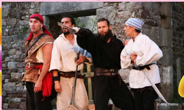
La Vraie Vie des Pirates, un spectacle de Grégory Bron, mis en scène par la Cie AfAg Théâtre et avec AFAG Théâtre. Production Compagnie AfAg Théâtre.